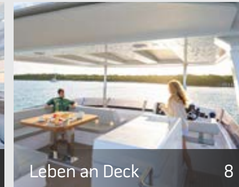
Leben an Deck