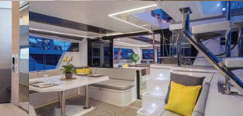
Außergewöhnlich. Die Eignerkaajüte ist sehr geräumig, bietet ein großes, leicht zugängliches Bett, einen Schminktisch und viel Stauraum (ganz links). Öffnet man die Schiebefenster, verschmelzen Salon und Achtercockpit zu einer Einheit (links)

ge. So kann der Rudergänger sowohl mit den Gästen in der Lounge als auch jenen im Achtercockpit nahezu barrierefrei kommunizieren und fühlt sich nicht isoliert.